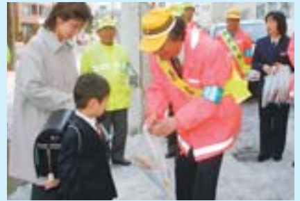
新入学児童一人一人に「気を付けて学校に通ってね」と声を掛けました