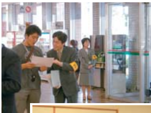
◀ 窓口案内や質問に対応する フロアマナージャー