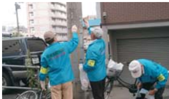
▲電柱に張られた違反広告物を丁寧に除去する西地区の地域の皆さん