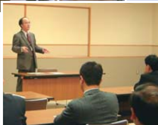
▶ 各課長が中心となり、職員を対象に行う業務研修会