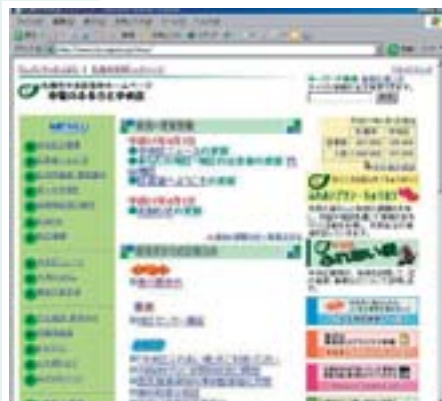
▲中央区役所公式ホームページ ( http://www.city.sapporo.jp/cho/ )