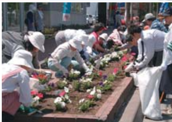
▲北3条通歩道できれいな花を植える地域の皆さん