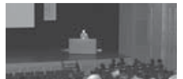
活動報告会とセミナーの様子

平成16年度、西区は環境モデル区として、5月に「地球に優しいまちづくり」を進める西区民会議(以下西区民会議)を設立。区民が主体となつて、環境に優しい取り組みを実践しています。今月号では西区民会議の現在の活動状況についてお知らせします。