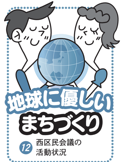
12 西区民会議の活動状況