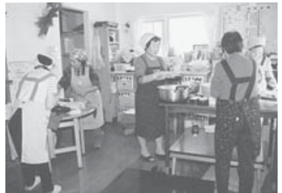
グループホームの昼食と夕食作りは大忙し。スタッフのチームワークでできばきとこなします。