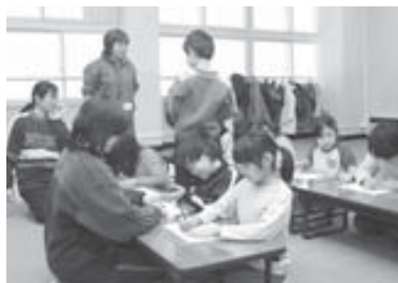
▲みんなで工作楽しいな！