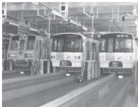
車両が保管されている留置線。旧型車両の6000型(左)と新型車両の8000型が並びます

基地内には、車両が出入りする出入庫線や、車両の検査、修理を行う工場線、洗車線、タイヤ交換線など、それぞれの作業用途に応じた線路が設けられています。