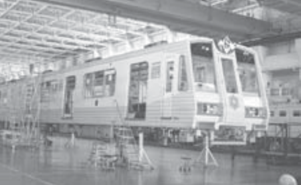
検査作業中の車両(上) 自動回送運転システム など車両運行を集中管理する信号扱所(右)

建物は、地上二階、地下一階、最大百六十両の車両を収容できます。車両の入庫部が地下と地上の二層構造になっているほか、本線から車庫内までを無人で回送させる自動回送運転システムといった先進的な設備も備えています。