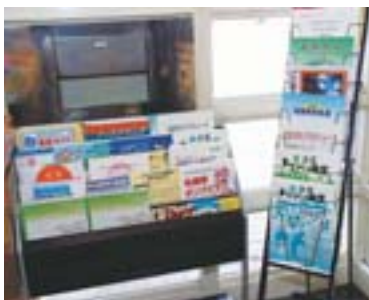
▲北区エピソード史や北区ウォーキングマップもあります