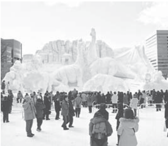
今年2月に開催された第55回さっぽろ雪まつり