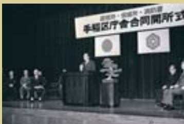
手稲区庁舎合同開所式の様子 (平成元年11月6日)