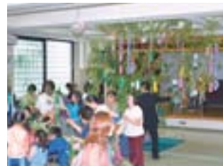
▲北都地区会館で行われた「七夕の集い」

簡単な打ち合わせなどに利用できる情報交換スペースを整備し、地域の皆さんの活動に提供します。