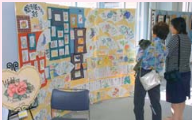
▲拓北・あいの里地区センターに展示された地域の人たちの力作

区内の各地区で開催された文化祭。9月25・26日には拓北・あいの里地区センター文化フェスタが、10月16・17日には篠路コミュニティセンター文化祭が開かれました。どちらも大勢の人が訪れ、地域の人たちのステージ発表や作品展示などを楽しげに鑑賞していました。