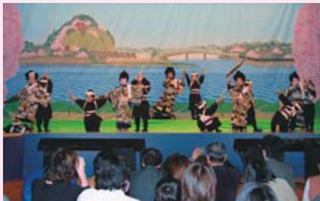
▲篠路子ども歌舞伎の熱演に、たくさんの拍手が送られました