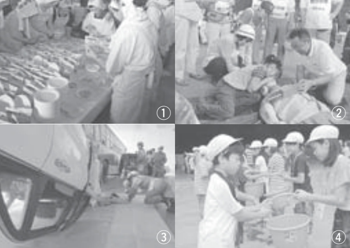
① 食料配布訓練 ② 心肺蘇生訓練 ③ 交通事故救出救助訓練 ④ 初期消火訓練