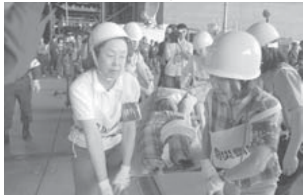
倒壊建物救出救助訓練