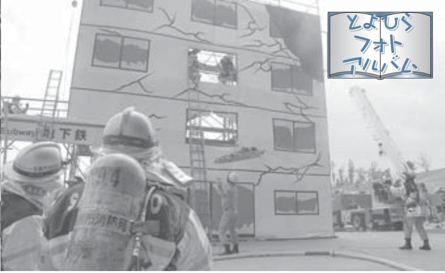
中高層建物消火救出訓練