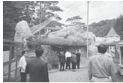
所管施設を視察する環境消防委員 ～円山動物園