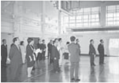
所管施設を視察する文教委員 ～札幌星園高等学校