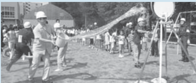
▲鉄西会場では北九条小学校で訓練を実施。子どもたちもバケツリレーに参加しました

9月1日の防災の日に、実際の災害を想定して2カ所で実施された北区防災訓練。地域の人たちが主体となり、消火や救護などさまざまな訓練に取り組みました。参加した人たちは、災害に対する備えの大切さをあらためて確認したようです。