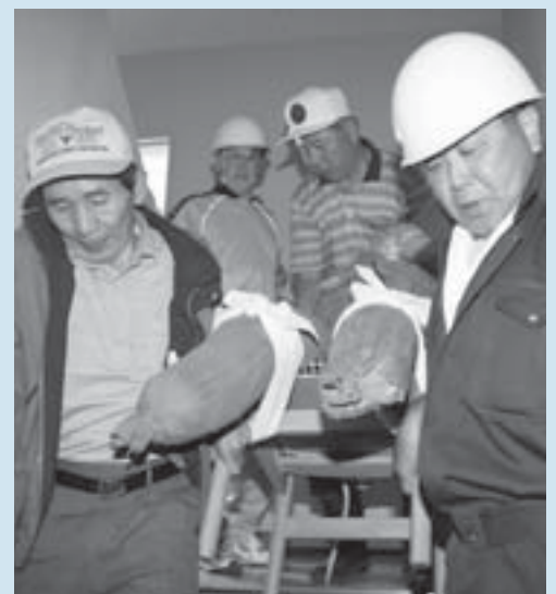
▲あいの里会場では人形を使い、負傷者を救出する訓練も行いました