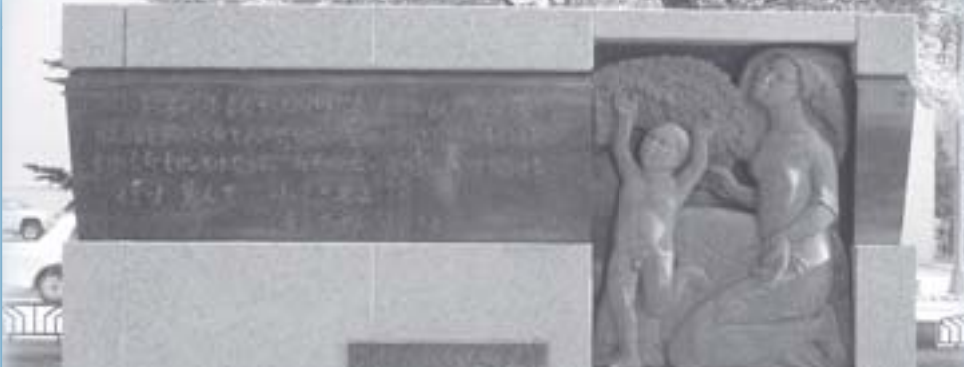
ありしまたは お ①有島武郎文学碑(大通西9大通公園内)

札幌農学校（現北大）の出身で、白樺派の文学者。「或る女」や「生まれ出づる悩み」、「小さき者へ」などの作品が有名ですが、この文学碑には同じ白樺派の作家武者小路実篤の手によって「小さき者へ」の一節が刻まれています。