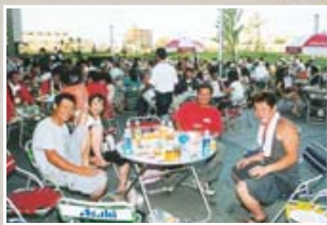
▲多くの人々が会場を訪れ、お祭りを楽しみました