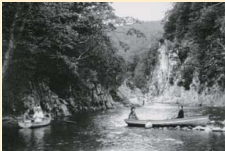
当時流行した「玉川の舟遊び」の様子。 (昭和5年)

緑豊かな景観と、それを映すゆるやかな水面は、今も変わりありません。 (平成16年7月)