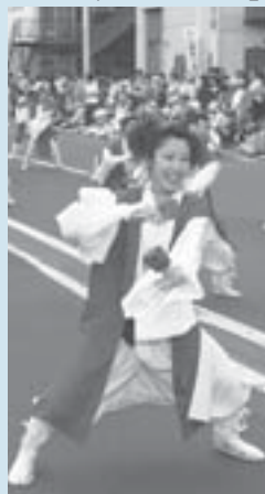
▼新琴似会場でリズムカルに踊る「新川天狗乱舞」

札幌の初夏の訪れを告げるYOSAKOIソーラン祭り。区内でも、6月12・13日の2日間にわたり、迫力ある踊りや優美な舞が次々と披露されました。会場に集まった観客たちからは、拍手や声援が盛んに送られ、祭りは大いに盛り上がっていました。