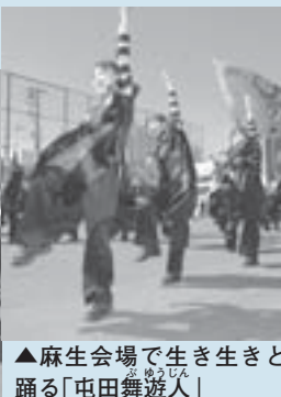
▲麻生会場で生き生きと踊る「屯田舞遊人」