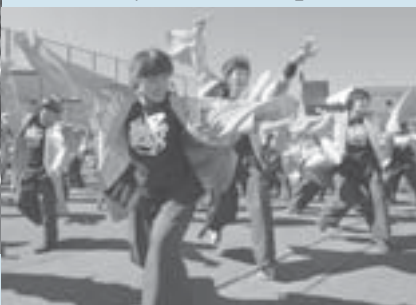
▲新琴似会場でときに優雅に、ときに激しく踊り、観客を魅了した「新琴似天舞龍神」