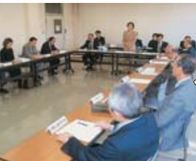
▶5月11日には「地球に優しいまちづくりを進める西区民会議」設立発起人会が開催されました