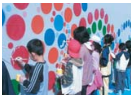
▶昨年は地元の小学生在が旧中の川遊歩道で壁画制作を行いました