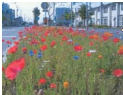
▶二十四軒手稲通の「花回廊」7月にはポピーが満開になります