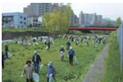
▶5月15日の琴似発寒川の一斉清掃にはたくさんの方が参加しました