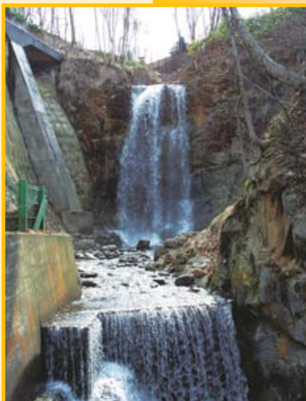
▲今でも変わらずしぶきを上げています (平成16年5月)