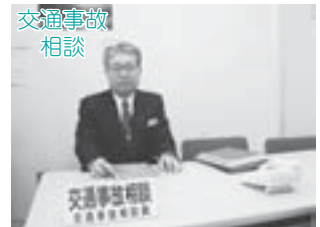
▲一人で悩まずお早めに相談してください