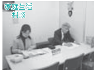
▲家庭生活に関するご相談を幅広くお受けしています