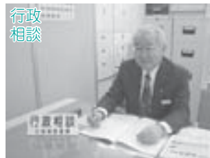
▲国の仕事のことなどで困ったときは、ご相談ください