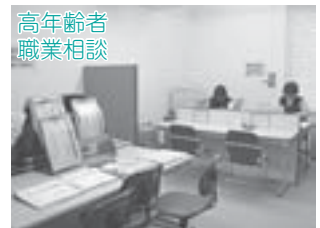
▲求人票の閲覧と職業紹介を行っています