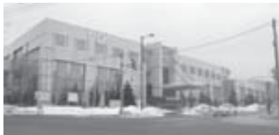
▲区役所・区民センター・保健センターが一つの建物になっています

住所 : 前田1条11丁目 電話 : 681-2400(代表) 開庁日 : 月曜日～金曜日(祝日年末年始を除く) 業務時間 : 午前8時45分～午後5時15分 交通 : JR手稲駅北口から徒歩約5分(連絡通路でつながっています)