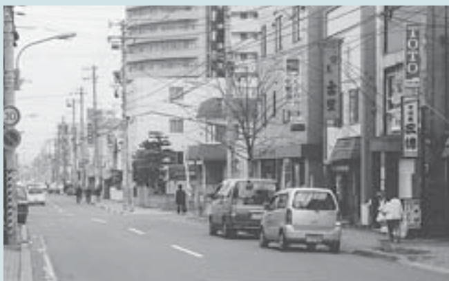
▲現在の都通（二十四軒4-6付近）