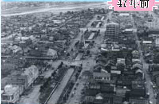
昭和32年(1957年)、南2西1上空から