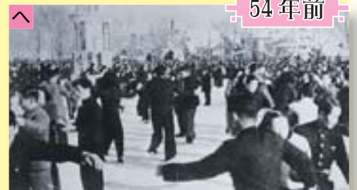
昭和25年(1950年)の第1回雪まつりでのスクエアダンス