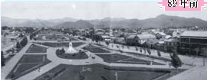
大正4年(1915年)の大通西3丁目周辺