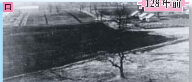
明治9年(1876年)の山鼻村一帯