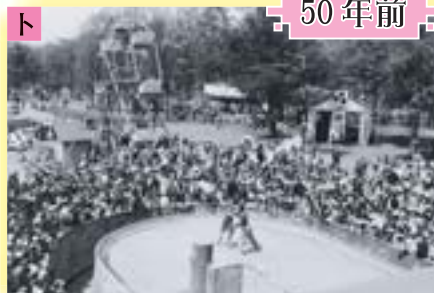
昭和29年(1954年)の円山動物園