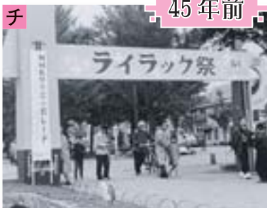
昭和34年(1959年)の第1回ライラックまつり