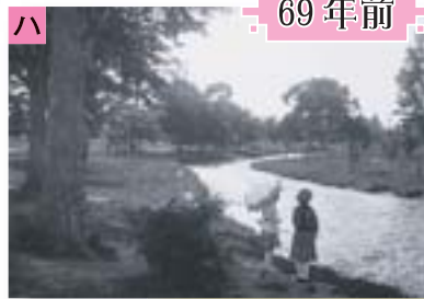
昭和10年(1935年)の中島公園