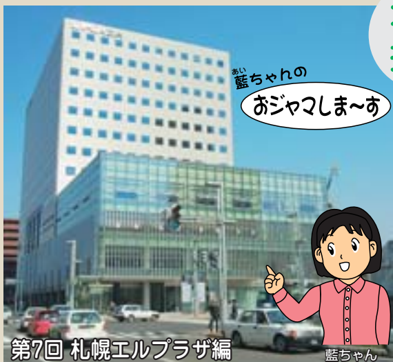
第7回 札幌エルプラザ編