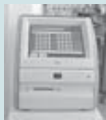
▲気軽に本を探せます