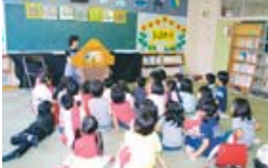
—小野幌小開放図書館— (上)ボランティアの手で飾り付けられた室内は明るく開放的。昼休みにはたくさんの子どもたちでにぎわいます。(左)おはなし会の様子。