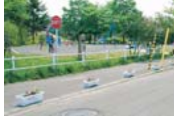
—大谷地東小学校— (上)地域の人たちに教えてもらいながら花を植えました。(左)フラワーポットが設置された通学路。