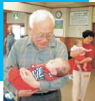
発寒地区の異世代交流