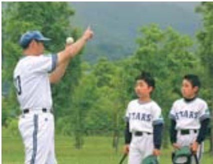
▲細かい指導を選手は真剣に聞きます