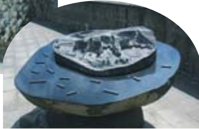
▲彫刻を見るだけでも楽しめます