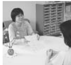
保育士の職員が対応

情報室には、8名の保健福祉サービス課職員（保育士）が在籍しており、子育てに関する心配ごとや悩みなどを気軽にご相談いただけます。「こんなこと相談してもいいのかな?」と思うことでも、遠慮なくお話しください。