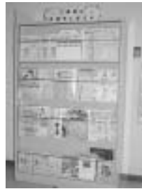
情報誌などが満載

区内で活動中の子育てサークルや、地域で行っている交流の場の情報を提供しています。このほか、子育て情報誌「子育てさっぽろ」や、子育てに関する制度やサービスをまとめた「子育てガイド」を配布。また、区独自に発行・配布している「清田区子育て情報マップ」では、より地域に密着した情報を提供しています。