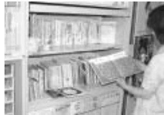
楽しい絵本がいっぱい

お子さんの年齢に適したお勧めの絵本や育児関連の書籍を約500冊、環境のことを楽しく学べる紙芝居「かたづけマン〜クリーンだいさくせん」などの閲覧・貸し出しを行っていますので、お気軽に職員に声をお掛けください。そのほか、いろいろな手作りおもちゃなどの紹介もしています。