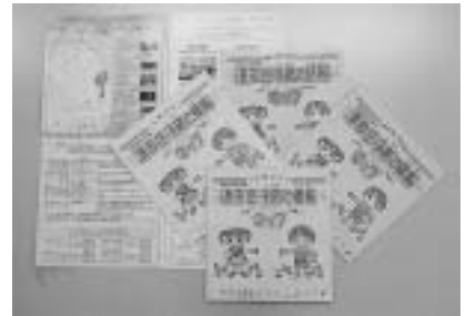
好評の「清田区子育て情報マップ」