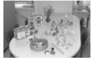
おもちゃの見本もご覧いただけます