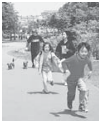
青葉児童会館の児童と地域の人たちが、青葉中央公園の北側の歩道に花を植えた後、公園内でクイズラリーを楽しみました (6月7日 自然にふれあう会)

大谷地東小学校のPTAと児童、大谷地町内会などが協力して、通学路にフラワーポットを設置しました。児童の安全のためステッカーを張り、歩道への駐車をしなないように呼び掛けています (6月7日 通学路に花いっぱい運動)