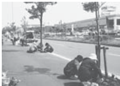
もみじ台ショッピングセンターを取り巻く歩道に、周辺の企業、自治会、老人クラブなどが、花を植えました。今後は地域全体に活動を広げていきます (6月7日 もみじ台フラワータウン事業)