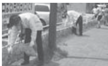
ごみゼロの日(5月30日)の清掃活動。 (右)市内の児童会館では、全館一斉に(写真は、しなの児童会館)。 (上)副都心周辺の企業、団体で構成されるクリーンアップ倶楽部