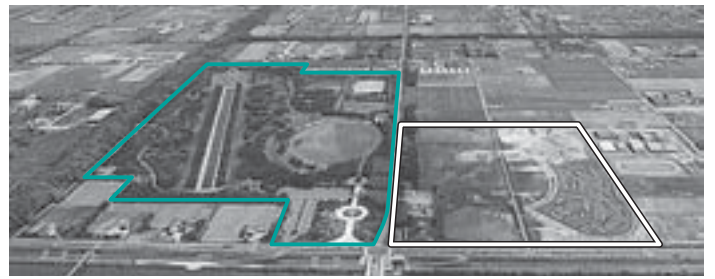
△前田森林公園。既存部分（緑の線で囲まれた部分）と整備が進められている拡張部分（白の線で囲まれた部分）