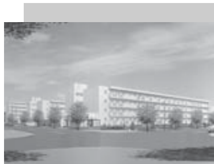
▲屯田季実の里団地に建てられる3棟は、いずれも今秋完成。年内に入居が始まる予定です

屯田九条五丁目に、市営住宅屯田季実の里団地の建設を進めています。また、百合が原六丁目では、借上市営住宅フレンズ百合が原の建設が進められています。