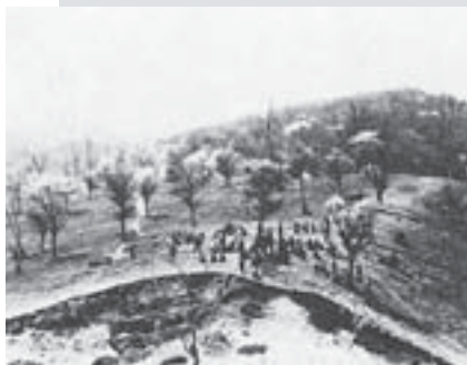
▲桜山での花見の様子(昭和10年代)

残された桜山は昭和四十五年に北海道の保健保安林に指定され、自然歩道が設けられました。また、昭和四十九年には、市内で初の歩くスキーコースが設置され、現在は、自然散策やバードウォッチングで訪れる人々に、四季を問わず親しまれています。