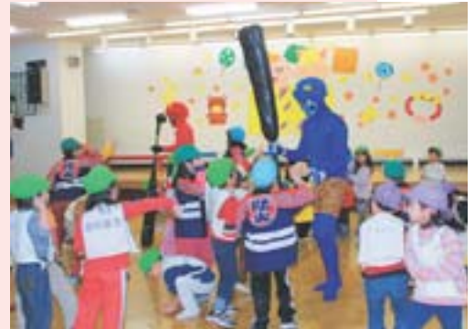
鬼は外～！（新さっぽろ幼稚園）