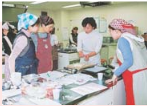
簡単に作れて栄養もたっぷり（ヘルシーマタニティクッキング）