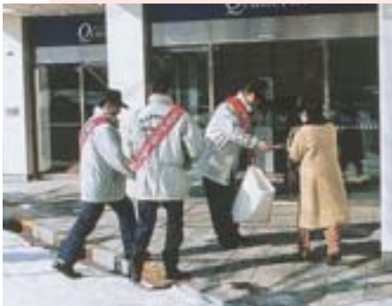
火の元には十分気をつけてください