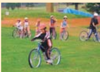
夏のフッズで楽しめます