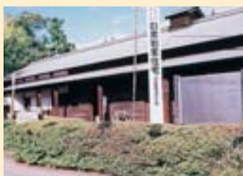
明治5年に建造の旧○○○○○通行屋