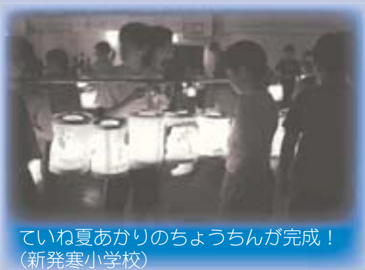
ていね夏あかりのちょうちんが完成！ (新発寒小学校)