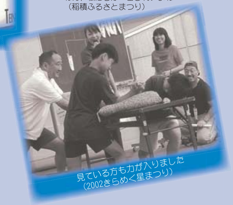
見ている方も力が入りました (2002きらめく星まつり)