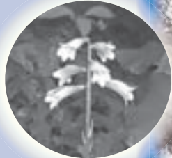
星置緑地の オオウバユリ