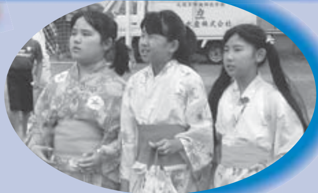
ねえ、私たちが一番きれいよね (稲積ふるさとまつり)