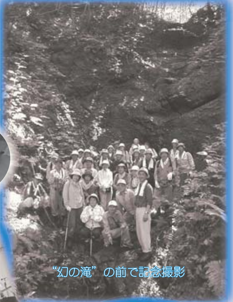
“幻の滝”の前で記念撮影