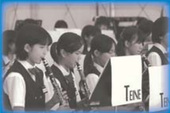
真剣さが伝わってきます (演奏・手稲中学校吹奏楽部)