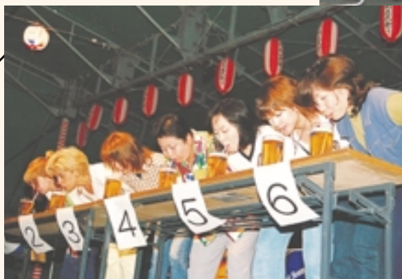
誰が早く飲めるかな？