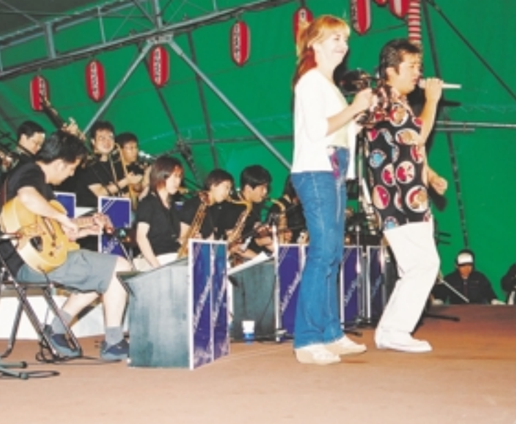
◀ビッグバンドの演奏には飛び入りも