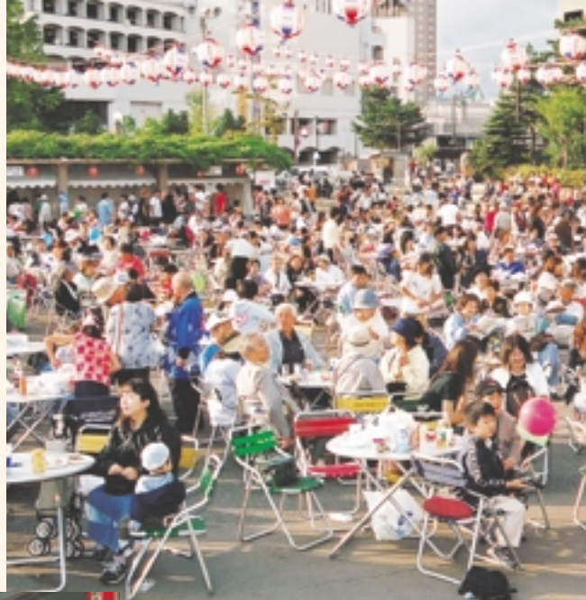
会場は、大勢の家族連れなどでにぎわいました