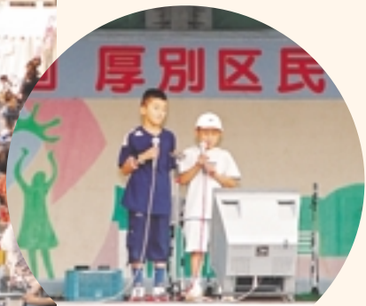
みんなの前で歌うと緊張するね