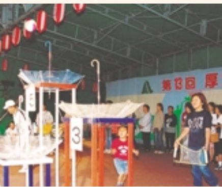
簡単に見えて難しい。ボールを傘に入れる「モノフリングゲーム」