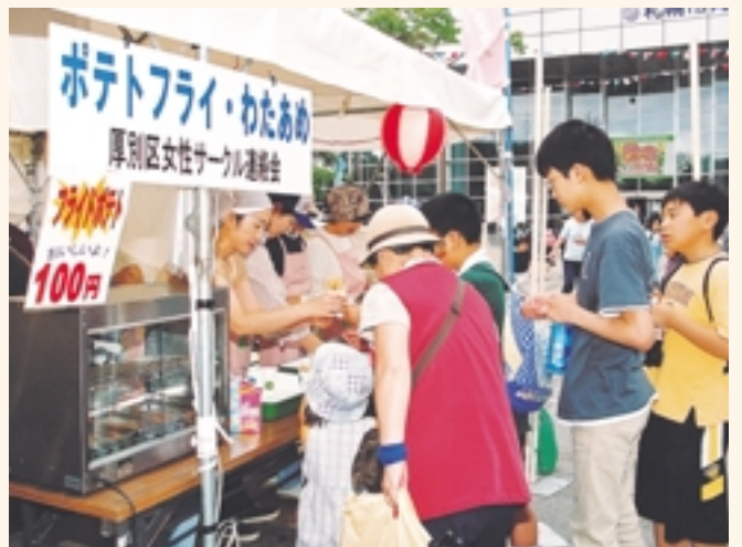
ポテトフライは子どもたちにも大人気