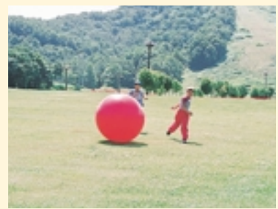
フィジカルボールにどっちが早く追いつくか

冬は『Fu'sスノーエリア』として、スキーやスノーボードはもちろん、新しいウインタースポーツを楽しむことができます。また、国内で2カ所しかないリュージュコースがあり、選手の迫力ある滑りを間近で見ることができます。