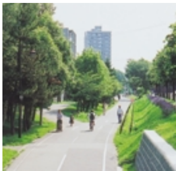
地下鉄大谷地駅周辺は、通勤や通学の人、買い物客など人通りが絶えません。