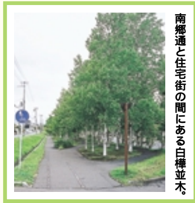
南郷通と住宅街の間にある白樺並木。

もみじ台を一周するコース 自転車道路は、滝野まで続く、滝野・上野幌自転車道路の一部と、もみじ台自転車道路を合わせた約六・四キロメートルのコースです。自然に囲まれ、まさに緑の中を走るこのコース沿線には、パークゴルフ場やテニスコートなどの運動施設があり、気軽にスポーツを楽しむことができます。