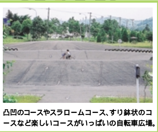
凸凹のコースやスラロームコース、すり鉢状のコースなど楽しいコースがたっぷりの自転車広場。