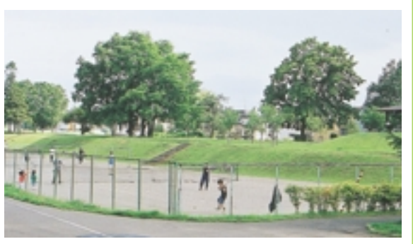
厚別南公園は、旧上野幌駅の跡地です。小高い丘の上には、駅のシンボルだったイチイの木が今も残っています。野球場やテニスコート、自転車広場などがあります。

白石サイクリングロード 白石区東札幌から上野幌までの札幌北広島自転車道路（白石サイクリングロード）は、総延長九・八キロメートルで、厚別区内は、区境を流れる厚別川に架かる虹の橋から、自然が残された厚別南緑地まで四・二キロメートル。旧国鉄千歳線を利用して整備されたコースです。