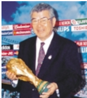
札幌市長 桂 信雄

6月の札幌は、さわやかな新緑に包まれる美しい季節。万全の態勢で開幕を迎えるとともに、皆さんと一緒に、国内外から訪れる人々へ札幌の魅力を存分にアピールしたいと思います。