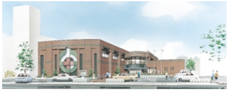
中央区地区センター（仮称）の完成予想図