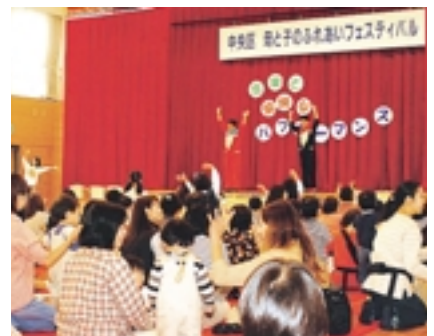
母と子のふれあいフェスティバル

豊かな国際感覚を持つ人材の育成のため、中央区とモンゴル国バヤンゴル地区の子供を中心とした交流を行います（七月下旬）。