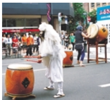
砂川市の桜太鼓は迫力満点

狸小路や駅前通などの都心部商店街で、道内市町村の参加による郷土芸能の祭典を開催します（七月下旬）。