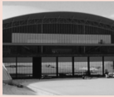
ムービングウォール