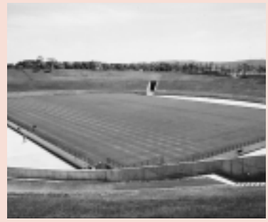
オープンアリーナと ホヴァリングサッカーステージ

応募しよう！応募方法については次のページへ。 答えが分かったら、はがきかファクスに必要事項を記入して