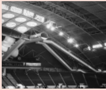
空中エスカレーター