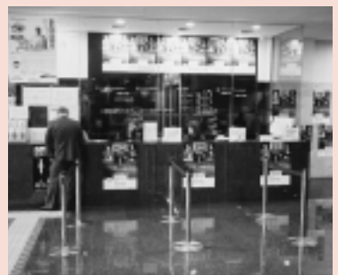
ウェルカムロビー