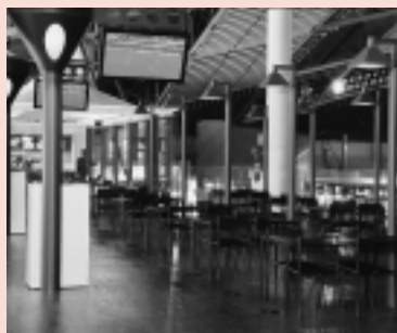
ボウブリッジ・カフェ