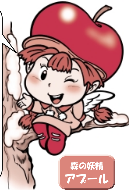
森の妖精 アプール

そこで今回は、この札幌ドームをテーマにしたパズルを作ってみたから、実際に行ったことのある人も、そうでない人も、ぜひ解いてみてね。正解者の中から、抽選で100人にすてきなプレゼントが当たるよ！