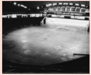
クローズドアリーナ

区民のみなさん、はじめまして。わたしは、妖精のアプール。豊平区内のある森の中に、ずーっと昔から住んでいて、区のことならなんでも知ってるのよ。