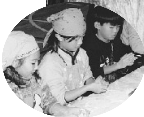
山の手児童会館「べったんもちつき大会」