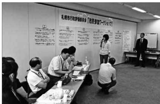
各グループの提案のまとめの内容発表