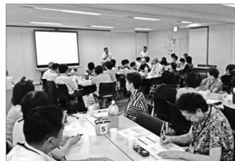
対象テーマ別勉強会の様子（午後の部）