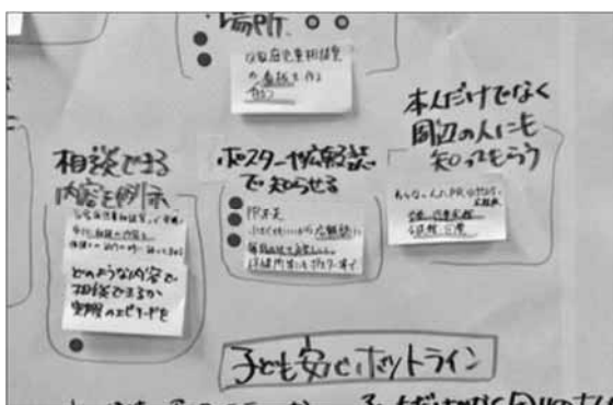
今後重要だと思う取組について、各自シール投票

最終的には、シール投票の結果も参考にしながら、各グループで五つ程度の提案をまとめ、短冊（横長の紙）に書き留めました。