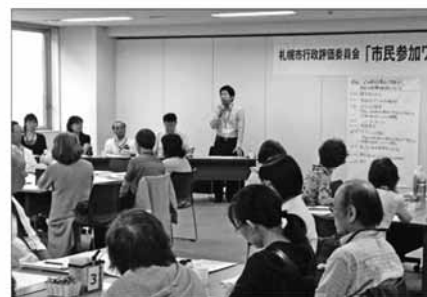
行政評価委員会吉見委員長（北海道大学大学院経済学研究科教授）あいさつ