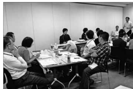
対象テーマ別勉強会の様子（夜間の部）