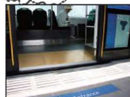
▲路面電車の低床車両導入