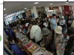
▲丘珠空港ビル内のイベント開催