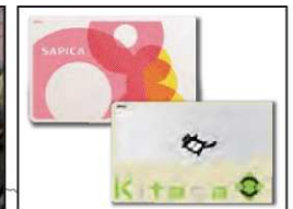
▲ICカードの相互利用など利便性向上