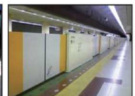
▲地下鉄全線ホーム柵設置