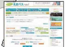
▲えきバスナビの利便性向上